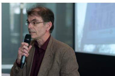
In 'actie' tijdens mijn presentatie.