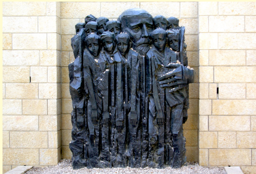
Janusz Korczak en de kinderen in Yad Vashem

Voor heel wat leerkrachten en pedagogisch medewerkers in de kinderopvang is Korczak in de afgelopen jaren, niet alleen in Nederland,